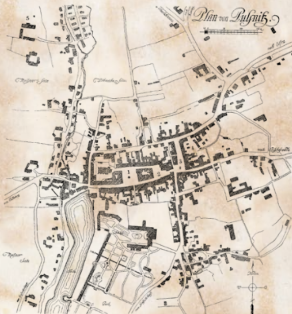
1 Markt. 2 Neumarkt. 3 Obermarkt. 4 Ehemals Friedhof. 5 Hussitenhaus. Fig. 358. Stadtplan, um 1870.