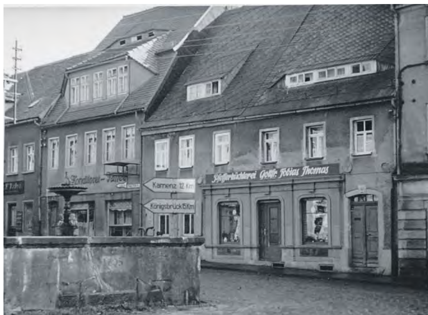
Szene im Verkaufsraum der Pfefferkücherei Gottfried Tobias Thomas; Werbeanzeige und Außenansicht der Pfefferkücherei Gottfried Tobias Thomas aus der DDR-Zeit