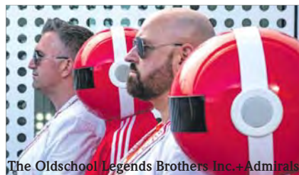
The Oldschool Legends Brothers Inc. + Admirals