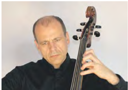
Professor für Alte Musik. Alle Freunde klassischer Musik sehr herzlich eingeladen, der Eintritt ist frei.