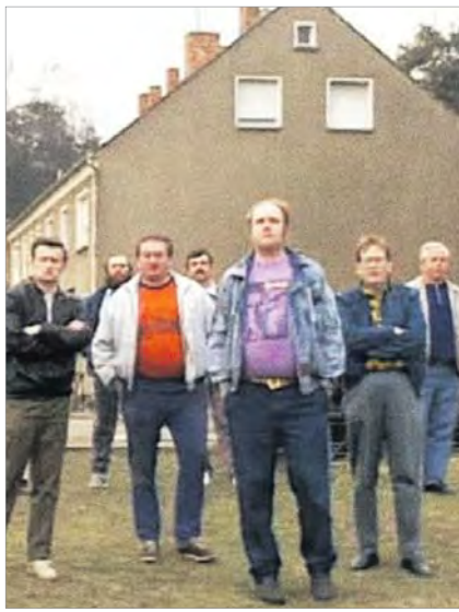
Der Ernst-Rietschel-Kulturring e.V. lädt am Wochenende 16./17. Mai zu zwei besonderen Veranstaltungen mit dem Kame-

ramann, Regisseur und Fotografen Peter Badel aus Berlin ein. Am Sonnabend, dem 16. Mai, findet im Kultursaal der VITREA Klinik Schloss Pulsnitz die Vorführung des Dokumentarfilms „Weißer Rauch über Schwarze Pumpe“ statt.