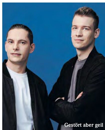
Gestört aber geil

Hinweis zum Stadtfest Nach der 800-Jahrfeier 2025 steht 2026 auch gleich ein weiteres Jubiläum an: Das Pulsnitzer Stadtfest feiert in diesem Jahr seine 30. Ausgabe! Und so laden wir wieder drei Tage lang herzlich dazu ein, dieses Jubiläum in der Pulsnitzer Innenstadt um den Markt, Ziegenbalgplatz und Schützenplatz zu feiern. Damit auch das diesjährige Stadtfest wieder in guter Erinnerung bleibt, bitten wir unsere Gäste für anfallenden Müll die vorgesehenen Behälter zu benutzen. Die Toiletten befinden sich im Rathausinnenhof, am Parkplatz Wittgensteiner Straße (Durchgang Griechisches Restaurant/Sparkasse) und am WE auf dem Schützenplatz.