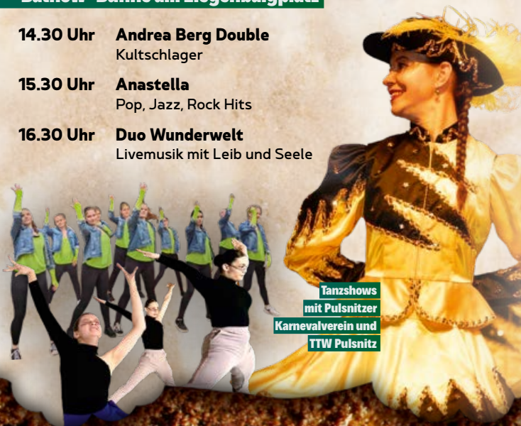
Tanzshows mit Pulsnitzer Karnevalsverein und TTW Pulsnitz

30. Pulsnitzer Stadtfest! 8. bis 10. Mai 2026